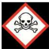
Sehr giftig, giftig